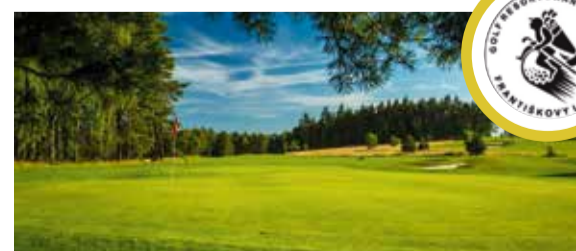
GOLF RESORT FRANZESBAD – HAZLOV www.gr-fl.cz