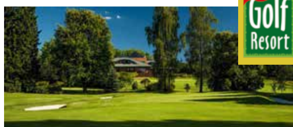
GOLF RESORT KARLOVY VARY www.golfresort.cz