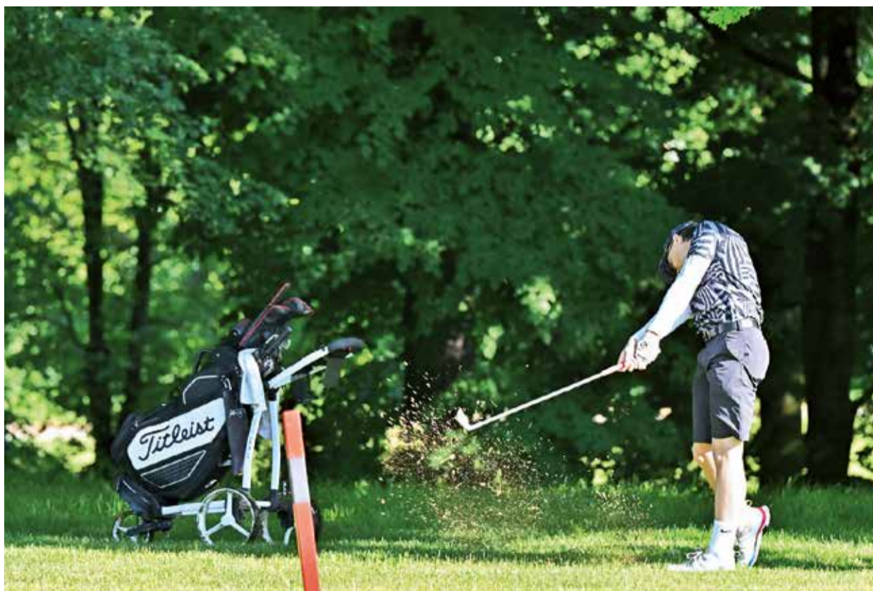
Ilustrační foto: Zdeněk Sluka

Kolíky, cedule a kameny na odpalištích, jejich odstraňování a vrácení při údržbě znamenají roční náklad,