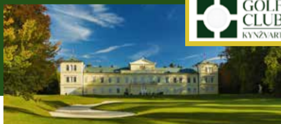
GOLF CLUB KYNŽVART www.golfkynzvalt.cz