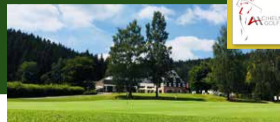
CIHELNY GOLF & WELLNESS RESORT www.axxoshotels.com/cs/golf-cihelny