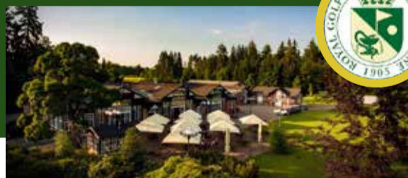
ROYAL GOLF CLUB MARIÁNSKÉ LÁZNĚ www.golfml.cz