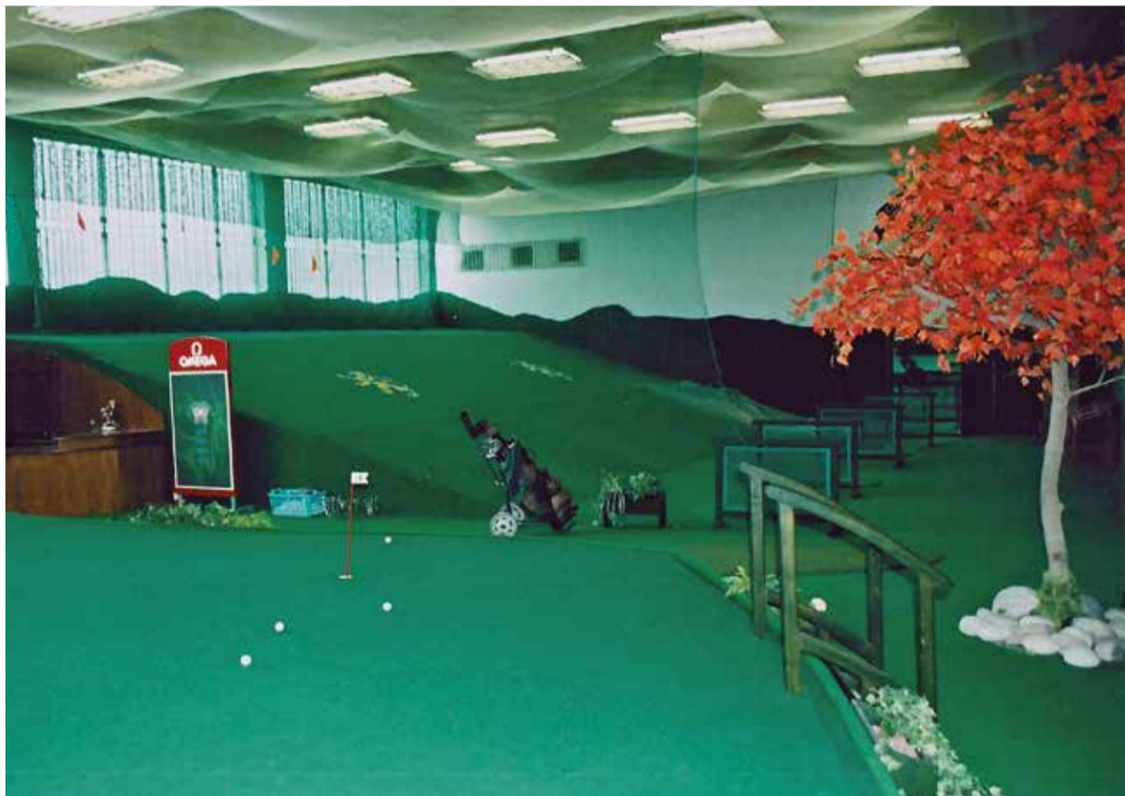
Indoor ve Zlíně

Vyhlášený hotelový komplex Čertousy měl být doplněn restaurací, bowlingem – a golfem. Budova byla v hrubé stavbě dokončena, ale kvůli neshodám majitelů se projekt zastavil a prostory jsou dodnes využívány jako sklady a garáže.