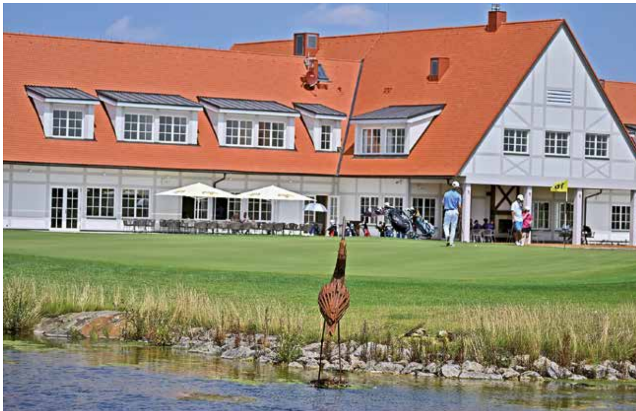
Jezero ve Vínore

„Voda a golfové hřiště? Jejich plocha není u nás významná a nemyslím, že by zavlažování bylo v budoucnosti problémem. Větším problémem bude