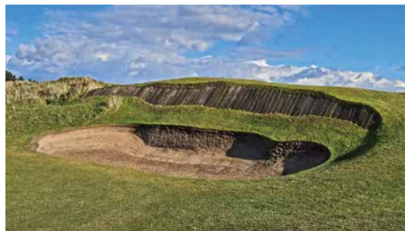
Southport & Ainsdale, dechberoucí fairwayový bunker na šestnácté jamce.

Ostrov Man je proslaven motocyklovými závody Tourist Trophy. Let z Liverpoolu na tento poklidný ost-