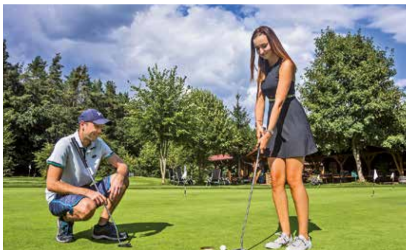
Golf Lázně Bohdaneč

Golfový areál se nachází v sousedství malebného města Lázně Boh-