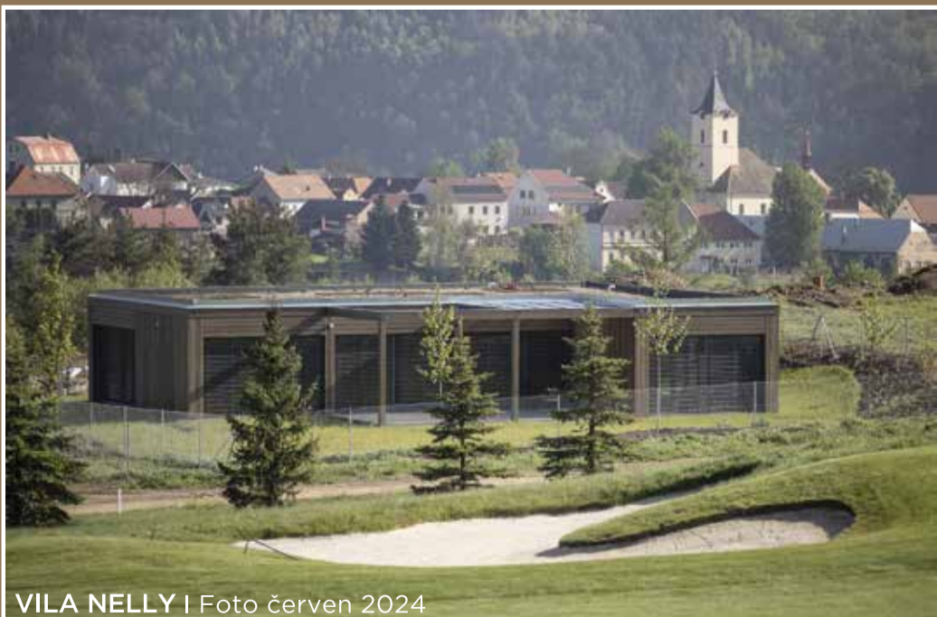
VILA NELLY | Foto červen 2024