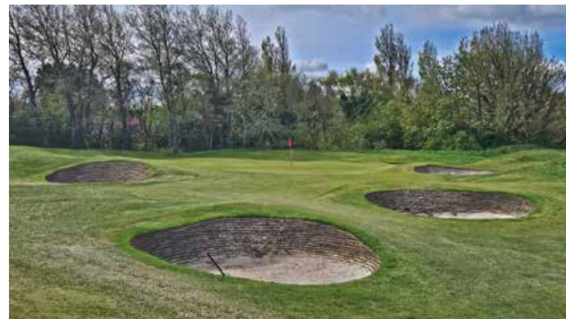
Hesketh GC a jeden z greenů v klasické linksové části.

englishgolfcoast true test • true spirit