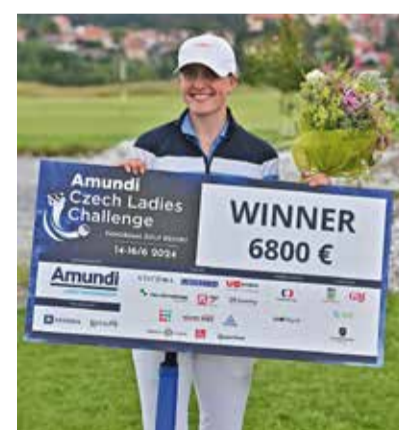
Nejlepší profesionálka se šekem