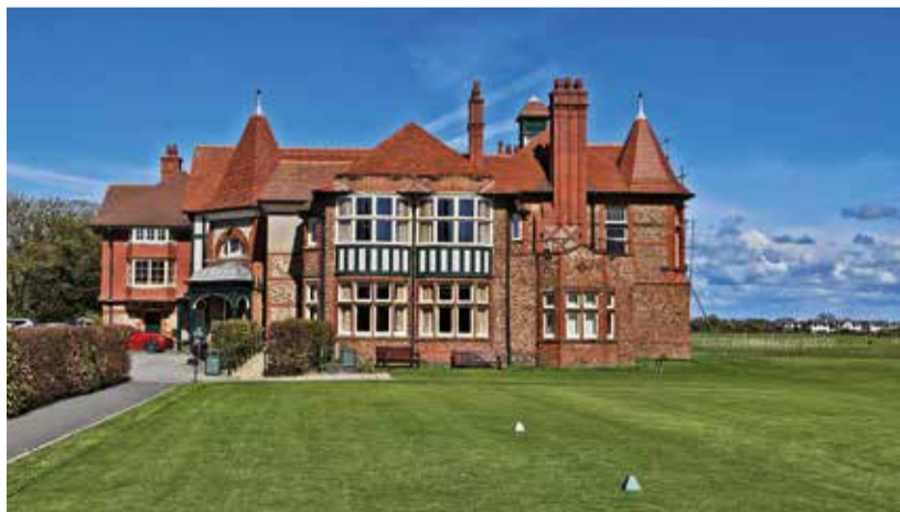
Odpaliště první jamky hned u majestátní klubovny na Royal Lytham & St. Annes.

ště začíná od klubovny přehledným párem 3. Podobně jako na Formby Ladies jsou zde velké plochy nízkého vřesu. V kombinaci s vysokou nažloutlou travou a vysokými borovicemi na pohled velmi zajímavé. Top jamkou jsou osmička, bezbunkerový par 3, jehož green tvoří vyvýšené plato, a hlavně šestnáctá jamka hraná podél kolejí (za nimi uvidíte golfisty na dalším slavném hřišti Hillside). Zde je málo vídaný fairwayový bunker, kde skončit nechcete. Jde o hluboký bunker pod svahem, jehož