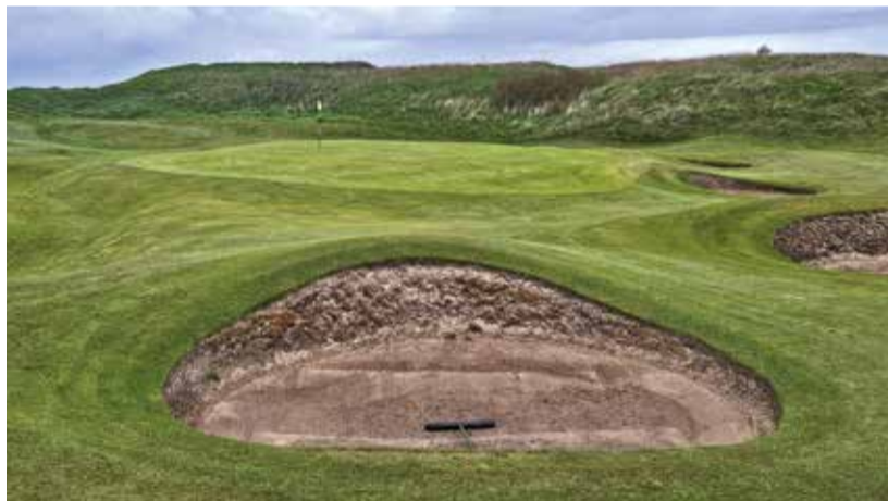
Typické okolí greenů na West Lancashire GC.