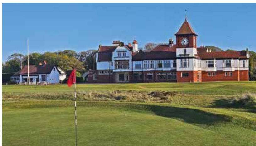
Obě poslední jamky Formby GC i Formby Ladies GC končí před klubovnou.

Southport & Ainsdale GC již od vstupu připomíná, že byl dvojnásobným hostitelem Ryder Cupu. Hři-