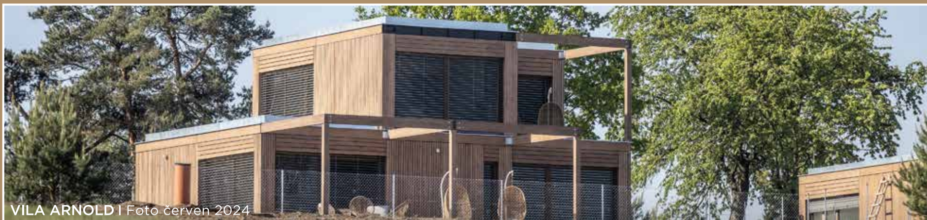
VILA ARNOLD | Foto červen 2024